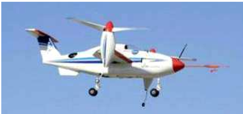
Рис. 1. Реализованный конвертоплан (Южная Корея)

этом двигатели – или крыло в целом – могут поворачиваться относительно горизонтальной оси, перпендикулярной к фюзеляжу. В пилотируемом варианте такая схема реализована достаточно давно (см. рис. 1).